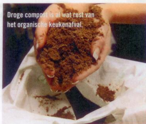
Droge compost is al wat rest van het organische keukenafval.

www.eco-cycle.nl ; www.deburg.nl ; www.puremarkt.nl